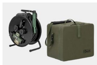
Kabeltrommel VX1 SEPOS®, 15/12 m (komplett) Art.-Nr. 2903170460