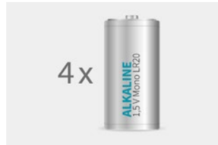
Alkaline-Batterie 1,5 V Mono LR20, 4 Stück Art.-Nr. 5910001006S4