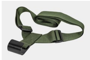
Tragegurt VX1 Art.-Nr. 8903170820