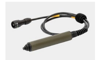
Start/Stop-Taster VX1 Art.-Nr. 2503170160