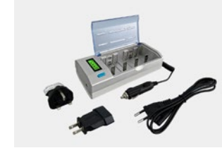
Externes Universal-Ladegerät 100-240V/50-60Hz, 12V Art.-Nr. 2909990847