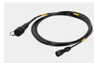
Anschlusskabel SEPOS®-Bohrloch (VX1) Art.-Nr. 2503170040