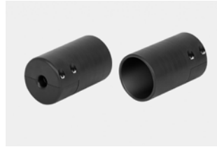
Bohrlochschuttrichter Art.-Nr. 2900130170