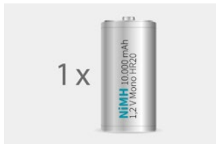
NiMH-Akkus 1,2 V Mono HR20/10.000 mAh Art.-Nr. 5920001006