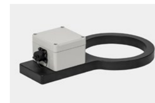
Detektor SEPOS®-Bohrloch Art.-Nr. 2900130130