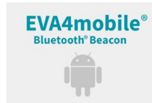
EVA4mobile® – Bluetooth® Beacon zur temporären Lizenzaktivierung Art.-Nr. 2009080000