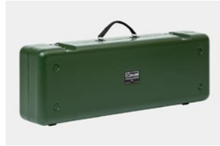
Koffer VX1 Art.-Nr. 2903170410