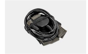
Kopfhörer VX1/VXT1 Art.-Nr. 2903170320