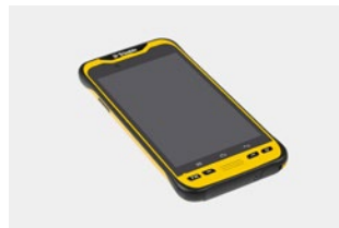
VFC4.1 – kleiner Feldcomputer für EVA4mobile® Art.-Nr. 2005350001