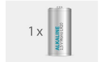
Alkaline-Batterie 1,5 V Mono LR20 Art.-Nr. 5910001006