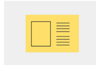
Rucksackbild VX1 Art.-Nr. 8903170890