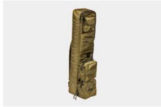
Rucksack VX1 Art.-Nr. 8903170610