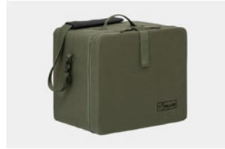
Tragetasche VX1 Kabeltrommel Art.-Nr. 2903170401