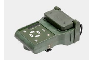
Bedienelektronik VX1 Art.-Nr. 2903170040