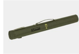
Transportbehälter für digitale Sonde VSM4 Art.-Nr. 2903170450