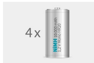
NiMH-Akkus 1,2 V Mono HR20/10000mAh, 4 Stück Art.-Nr. 5920001006S4