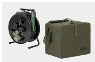
Kabeltrommel VX1, 25 m (komplett) Art.-Nr. 2903170240