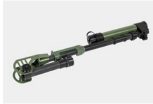
Tragestange VX1 Art.-Nr. 2903170030