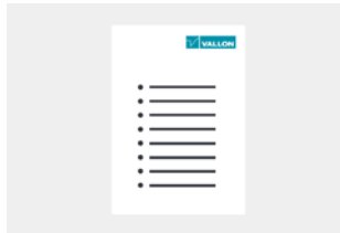
Bedienungsanleitung VX1 Art.-Nr. 2903170330