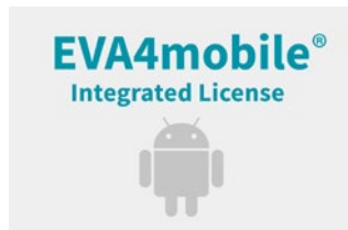
EVA4mobile® – Integrierte Lizenz in Kombination mit Feldcomputer VFC4.1 Art.-Nr. 2405350010