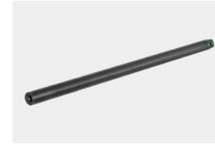
Digitale Sonde VSM4 Art.-Nr. 2005320010