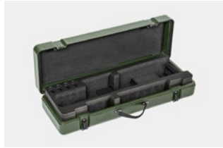
Koffer VX1 mit Einsatz Art.-Nr. 2903170530