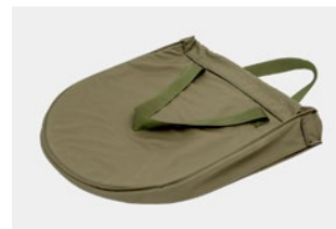
Tasche UXO-Suchspule groß, Oliv Art.-Nr. 8702360002