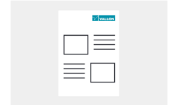
Kurzbedienungsanleitung VMH3CS Art.-Nr. 2902360407