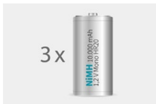
NiMH-Akkus 1,2 V Mono HR20/10.000 mAh, 3 Stück Art.-Nr. 5920001006S3