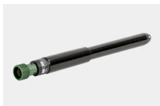
Stabsonde VMH3CS Art.-Nr. 2802360002