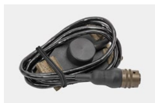
Kopfhörer VMC1/VMH3CS/VMXC1-1 Art.-Nr. 2909990571