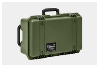
Koffer VMH3CS Art.-Nr. 2802360101