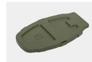
Suchspulenabdeckung, oval Art.-Nr. 8902293002