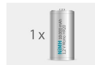
NiMH-Akkus 1,2 V Mono HR20/10.000 mAh Art.-Nr. 5920001006