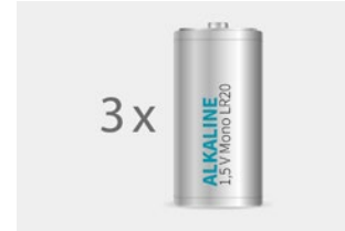
Alkaline-Batterie 1,5 V Mono LR20, 3 Stück Art.-Nr. 5910001006S3