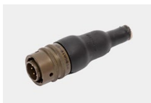
Kopfhöreradapter, 6 Pol auf Klinke, 3. Generation Art.-Nr. 2909990751