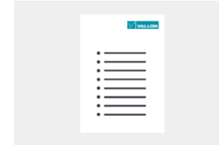
Bedienungsanleitung VMH3CS Art.-Nr. 2902360406