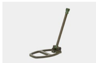
Suchspule, oval VMH3CS/VMXC1 Art.-Nr. 2902360101