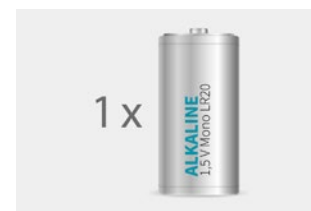
Alkaline-Batterie 1,5 V Mono LR20 Art.-Nr. 5910001006