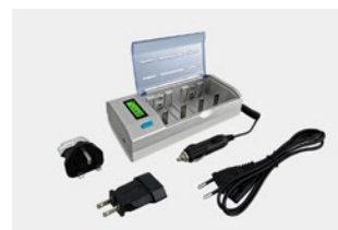
Externes Universal-Ladegerät 100-240V/50-60Hz, 12V Art.-Nr. 2909990847