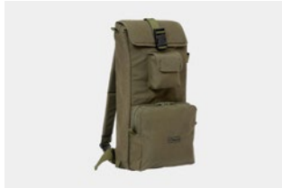
Rucksack VMH3CS Art.-Nr. 8902360007