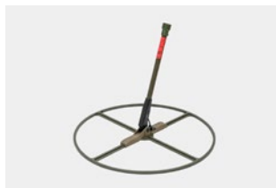
UXO-Suchspule, Ø 60 cm Art.-Nr. 2902360111