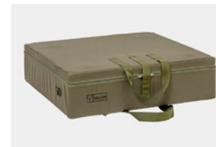
Universal Tasche UXO-Suchspule groß Art.-Nr. 2802360102