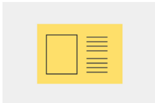
Rucksackbild VMH3CS Art.-Nr. 2902360408