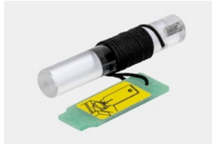
Teststück mit Einstellplättchen für Bremsschraube Art.-Nr. 2909990733