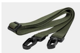
Tragegurt VMW1 Art.-Nr. 8709990003