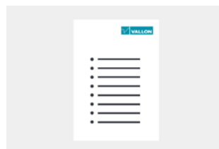
Bedienungsanleitung VMW1 Art.-Nr. 2902520021