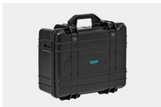
Koffer VMW1 Art.-Nr. 2802520001