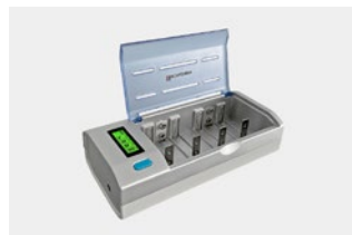
Externes Universal-Ladegerät 100-240V/50-60Hz, 12V Art.-Nr. 2909990847