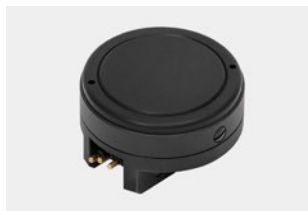
Lautsprecher für die Alarmwiedergabe an Land Art.-Nr. 2902520025