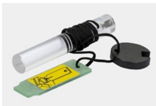
Teststück mit Einstellplättchen für Bremsschraube Art.-Nr. 2902310044