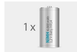
NiMH-Akkus 1,2 V Baby HR14/6.000 mAh Art.-Nr. 5920001018