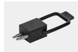
Blindstecker VMW1 Art.-Nr. 8902520051