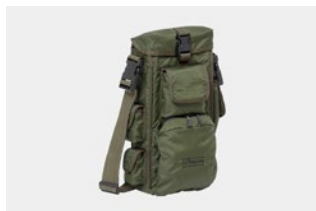
Tragetasche VMC1/VMW1 Art.-Nr. 8902310030