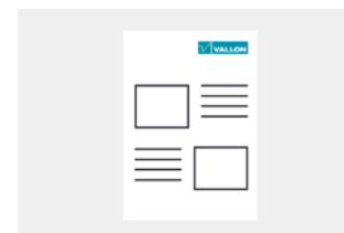
Kurzbedienungsanleitung VMW1 Art.-Nr. 2902520022