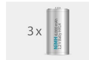
NiMH-Akkus 1,2 V Baby HR14/6.000 mAh, 3 Stück Art.-Nr. 5920001018S3