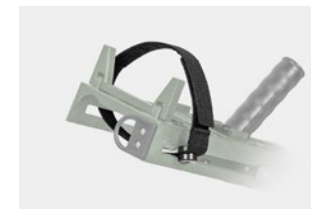
Armgurt VMW1 Art.-Nr. 2902520024