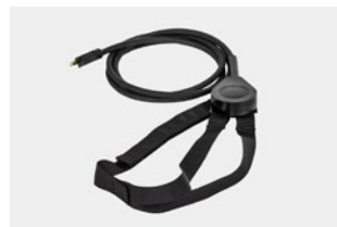
Kopfhörer VMW1 Art.-Nr. 2902520016