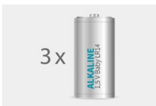
Alkaline-Batterie 1,5 V Baby LR14, 3 Stück Art.-Nr. 5910001002