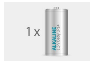
Alkaline-Batterie 1,5 V Baby LR14, Art.-Nr. 5910001002