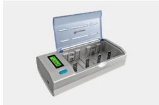
Externes Universal-Ladegerät 100-240V/50-60Hz, 12V Art.-Nr. 2909990847