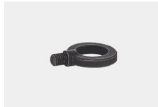
Ringschraube Art.-Nr. 2909990105