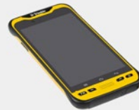
VFC4.1 – kleiner Feldcomputer für EVA4mobile® Art.-Nr. 2005350001