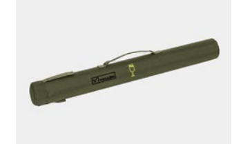
Transportbehälter für digitale Sonde VSM Art.-Nr. 2903170450