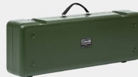
Koffer VX1 Art.-Nr. 2903170410