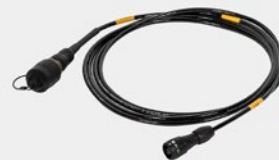
Anschlusskabel SEPOS®-Bohrloch (VX1) Art.-Nr. 2503170040