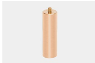
Zusatzgewicht Art.-Nr. 2909990631