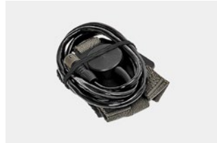
Kopfhörer VX1/VXT1 Art.-Nr. 2903170320