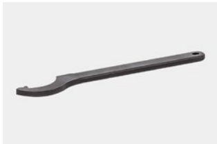
Hakenschlüssel Art.-Nr. 9150006024