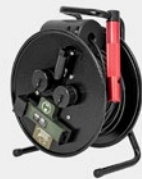
Kabeltrommel VX1 SEPOS®, 15/12 m Art.-Nr. 2903170470