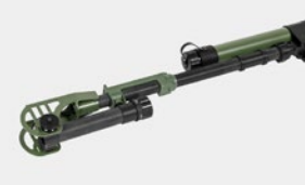
Tragestange VX1 Art.-Nr. 2903170030