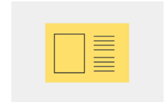
Rucksackbild VX1 Art.-Nr. 8903170890