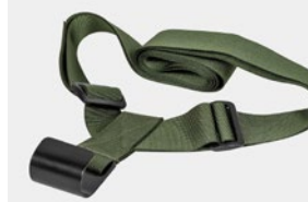
Tragegurt VX1 Art.-Nr. 8903170820