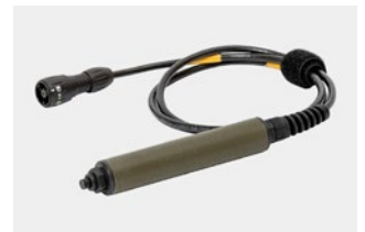
Start/Stop-Taster VX1 Art.-Nr. 2503170160