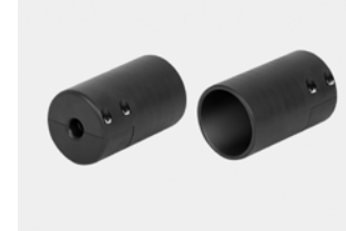
Bohrlochschutztrichter Art.-Nr. 2900130170