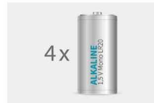
Alkaline-Batterie 1,5 V Mono LR20, 4 Stück Art.-Nr. 5910001006S4