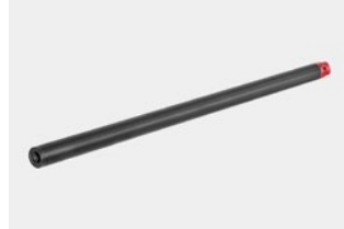
Digitale Sonde VSM Art.-Nr. 2909990674