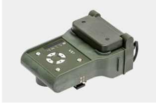
Bedienelektronik VX1 Art.-Nr. 2903170040