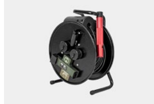
Kabeltrommel VX1, 25 m Art.-Nr. 2903170260