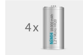
NiMH-Akkus 1,2 V Mono HR20/10000mAh, 4 Stück Art.-Nr. 5920001006S4