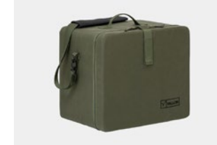
Tragetasche VX1 Kabeltrommel Art.-Nr. 2903170401