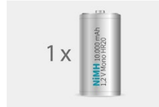
NiMH-Akkus 1,2 V Mono HR20/10.000 mAh Art.-Nr. 5920001006