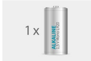
Alkaline-Batterie 1,5 V Mono LR20 Art.-Nr. 5910001006