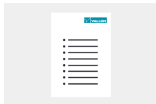
Mode d'emploi MH6 Réf. 8900340301