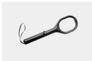
Détecteur à main pour opérations de sécurité MH6