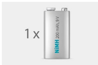
Accu NiMh 9 V/200mAh Réf. 5920001001