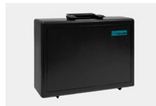
Valise Réf. 8900330006