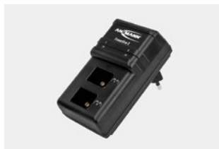
Chargeur Réf. 5900002010