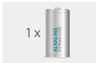
Pile alcaline bloc 9 V Réf. 5910001004