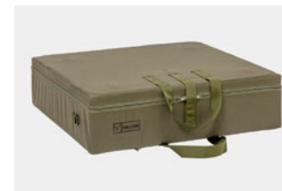
Valise universelle pour tête UXO large Réf. 2802360102