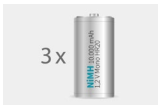
Accus NiMH 1,2 V Mono HR20/ 10.000 mAh, 3 unités Réf. 5920001006S3