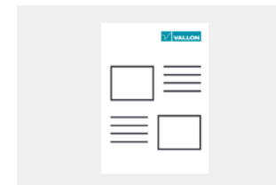
Manuel de terrain VMH3CS Réf. 2902360407