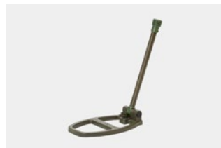
Tête de détection ovale VMH3CS/ VMXC1 Réf. 2902360101