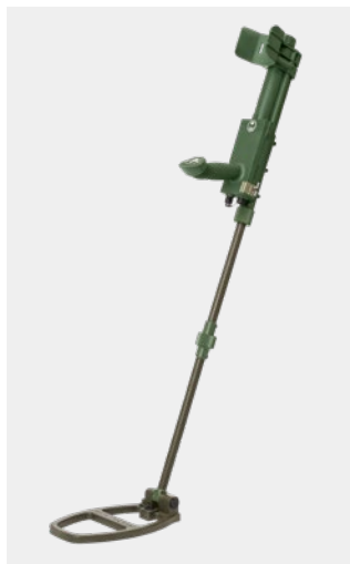
Détecteur de métaux VMH3CS