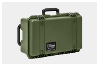
Valise VMH3CS Réf. 2802360101