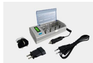
Chargeur universel externe 100-240V/50-60Hz, 12V Réf. 2909990847