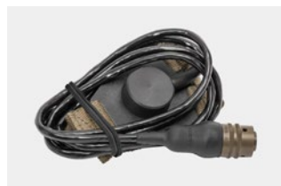
Casque d'écoute VMC1/VMH3CS/ VMXC1-1 Réf. 2909990571