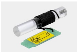
Pièce de test avec plaque de réglage pour vis de frein Réf. 2909990733