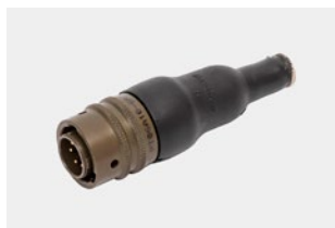
Adaptateur de casque 6 pôles, 3ème génération Réf. 2909990751