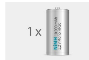
Accu NiMH 1,2 V Mono HR20/ 10.000 mAh Réf. 5920001006