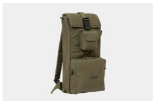
Sac à dos VMH3CS Réf. 8902360007