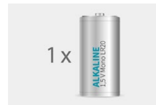
Pile alcaline 1,5 V Mono LR20 Réf. 5910001006