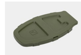
Protection pour tête de recherche, ovale Réf. 8902293002