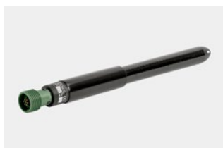
Sonde bâton VMH3CS Réf. 2802360002