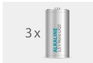
Piles alcalines 1,5 V Mono LR20, 3 unités Réf. 5910001006S3