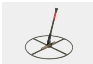
Tête de détection UXO Ø 60 cm Réf. 2902360111