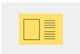
Descriptif de livraison VMH3CS Réf. 2902360408