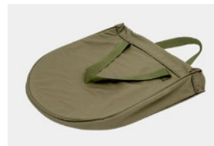
Sacoche pour tête de recherche UXO large, olive Réf. 8702360002