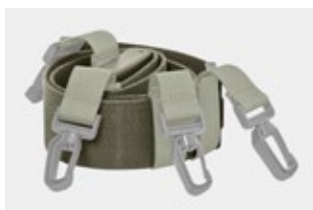
Cinturón Ref. 9150006007