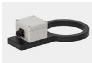
Detector SEPOS®- Pozo Ref. 2900130130