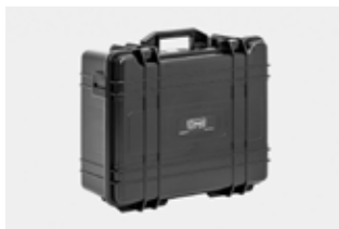
Maleta set electrónica VXB3plus Ref. 2902590090