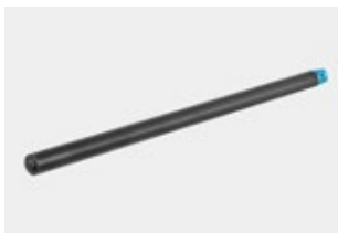
Sonda digital VSM3plus Ref. 2902280104