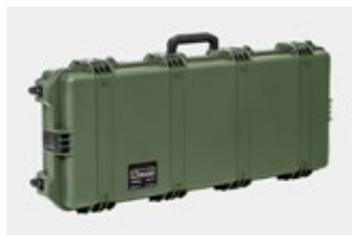
Maleta sonda VXB3plus Ref. 2902590080