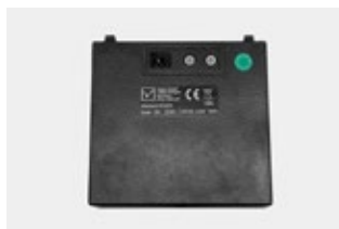
Batería VXB2/VXB3plus Ref. 2902540104