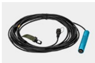
Cable sonda VXB3plus SEPOS®, 15 m/12 m Ref. 2502590101