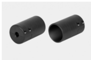
Embudo protector de pozo Ref. 2900130170