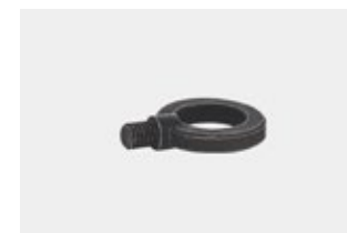
Anillo roscado Ref. 2909990105