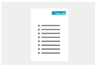
Manual operación VCU2 Ref. 8902540103