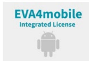
EVA4mobile® - Licencia integrada en combinación con el ordenador de campo VFC4 | Ref. 2405350010