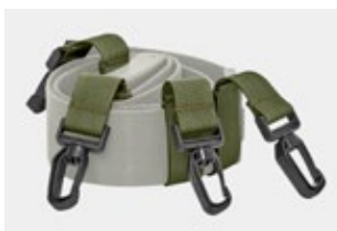
Mosquetón para cinturón Ref. 8902590005