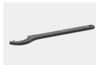
Llave de gancho Ref. 9150006024