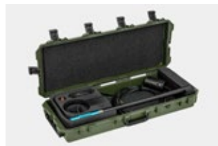
Kit sensor VXB3plus Ref. 2902590200