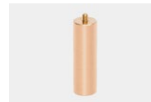
Peso adicional Ref. 2909990631