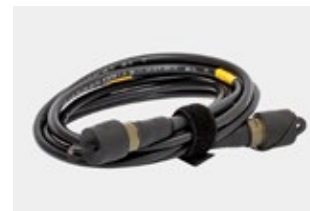
Cable conexión SEPOS®-Pozo (VCU) Ref. 2500130032