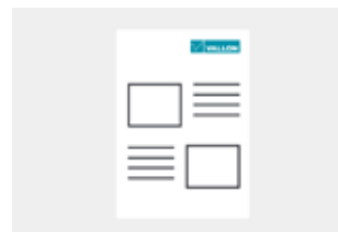
Manual de campo VFC4 Ref. 8905350000