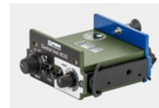
Unidad electrónica central VCU3 Ref. 2002540310