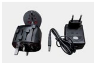
Set cargador Ref. 2902540110