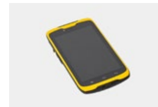
Ordenador de campo VFC4 Ref. 2005350000