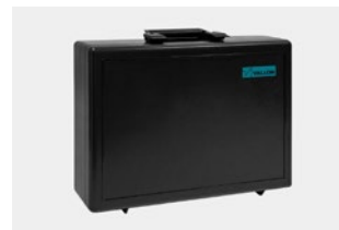
Maletín Ref. 8900330006