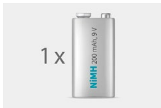
Baterías NiMH 9 Volt 200 mAh Ref. 5920001001