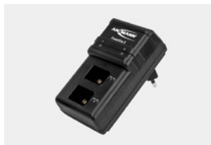
Cargador Ref. 5900002010