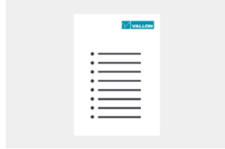
Instrucciones de uso MH6 Ref. 8900340301