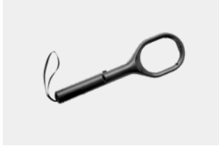
Detector de metales manual MH6