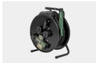
Bobina de cable VX1 SEPOS®, 15/12 m Ref. 2903170470