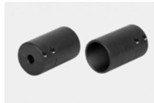
Embudo protector de pozo Ref. 2900130170