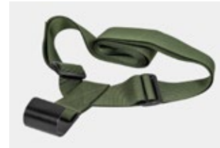
Correa transporte VX1 Ref. 8903170820