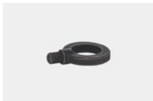
Anillo roscado Ref. 2909990105