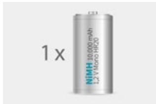
Batería recargable NiMH 1,2 V Mono HR20/10.000 mAh Ref. 5920001006