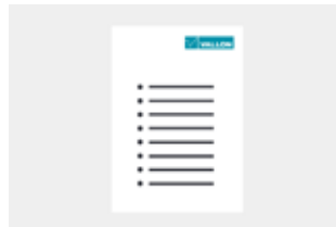
Instrucciones de uso VX1 Ref. 2903170330