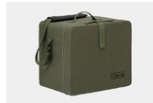
Bolso transporte bobina de cable VX1 Ref. 2903170401