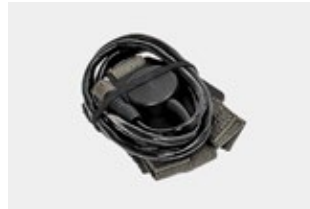
Auriculares VX1/VXT1 Ref. 2903170320