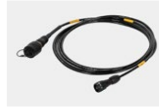
Cable conexión SEPOS®-Pozo (VX1) Ref. 2503170040