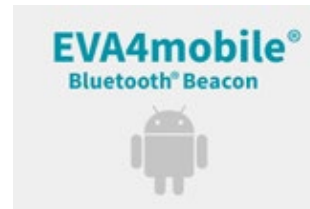
Bluetooth® Beacon para la activación de licencia temporal Ref. 2009080000