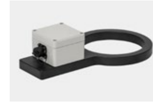
Detector SEPOS®- Pozo Ref. 2900130130