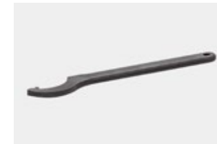
Llave de gancho Ref. 9150006024