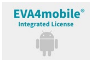
EVA4mobile® - Licencia integrada en combinación con el ordenador de campo VFC4.1 | Ref. 2405350010