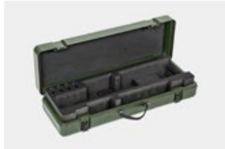
Maleta VX1 con postiza Ref. 2903170530