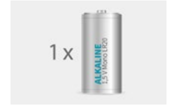
Batería alcalina 1.5 V Mono LR20 Ref. 5910001006