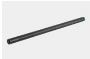
Sonda digital VSM4 Ref. 2005320010