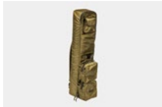
Mochila VX1 Ref. 8903170610