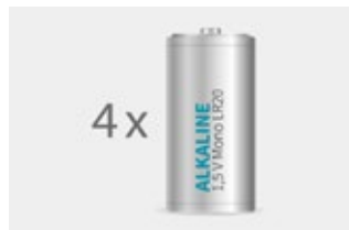
Batería alcalina 1.5 V Mono LR20, 4 unid. Ref. 5910001006S4