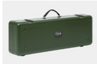
Maleta VX1 Ref. 2903170410