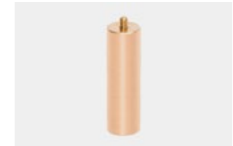
Peso adicional Ref. 2909990631