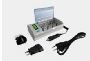
Cargador de batería externo Ref. 2909990847