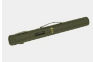
Bolso de transporte sonda digital VSM4 Ref. 2903170450