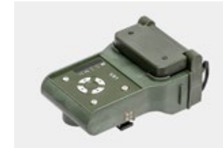
Unidad control VX1 Ref. 2903170040