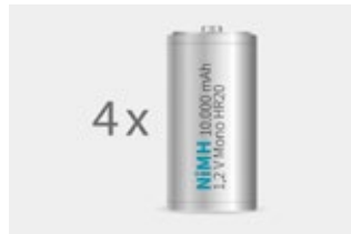
Batería recargable NiMH 1,2 V Mono HR20/10.000 mAh, 4 unid. Ref. 5920001006S4