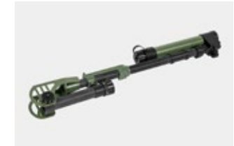
Barra de soporte VX1 Ref. 2903170030