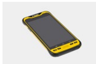
VFC4: Un pequeño ordenador de campo para EVA4mobile Ref. 2005350001