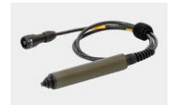
Interruptor start/stop VX1 Ref. 2503170160