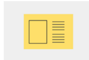
Croquis embalaje mochila VX1 Ref. 8903170890