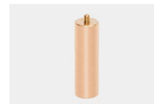
Peso adicional Ref. 2909990631