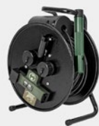
Bobina de cable VX1 SEPOS®, 15/12 m Ref. 2903170470