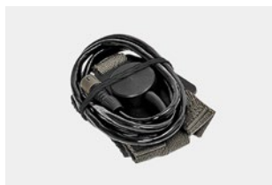
Auriculares VX1/VXT1 Ref. 2903170320