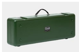
Maleta VX1 Ref. 2903170410