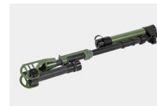
Barra de soporte VX1 Ref. 2903170030