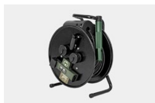
Bobina de cable, 25m Ref. 2903170260