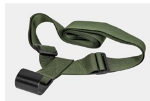
Correa transporte VX1 Ref. 8903170820