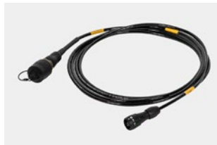
Cable conexión SEPOS®-Pozo (VX1) Ref. 2503170040