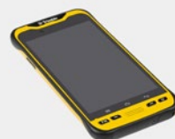
VFC4: Un pequeño ordenador de campo para EVA4mobile Ref. 2005350001