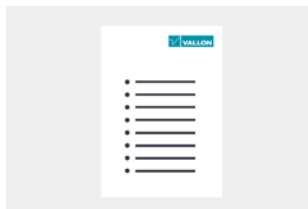
Instrucciones de uso VX1 Ref. 2903170330