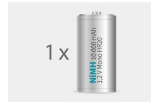
Batería recargable NiMH 1,2 V Mono HR20/10.000 mAh Ref. 5920001006