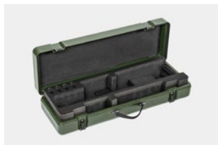
Maleta VX1 con postiza Ref. 2903170530