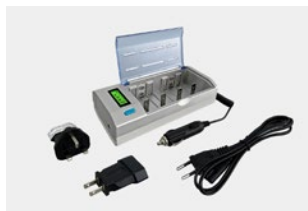
Cargador de batería externo Ref. 2909990847