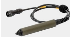
Interruptor start/stop VX1 Ref. 2503170160