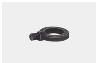
Anillo roscado Ref. 2909990105