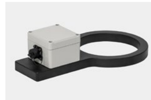
Detector SEPOS®- Pozo Ref. 2900130130