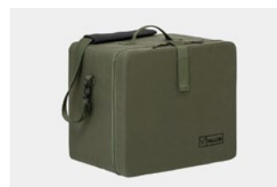
Bolso transporte bobina de cable VX1 Ref. 2903170401