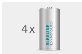
Batería alcalina 1.5 V Mono LR20, 4 unid. Ref. 5910001006S4