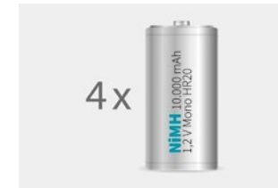
Batería recargable NiMH 1,2 V Mono HR20/10.000 mAh, 4 unid. Ref. 5920001006S4