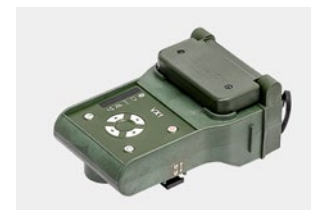
Unidad control VX1 Ref. 2903170040