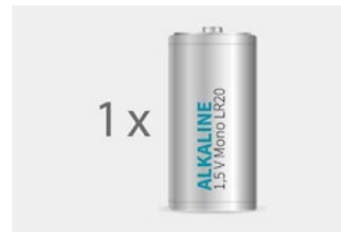
Batería alcalina 1.5 V Mono LR20 Ref. 5910001006