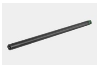
Sonda digital VSM4 Ref. 2005320010