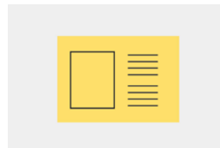
Croquis embalaje mochila VX1 Ref. 8903170890