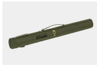
Bolso de transporte sonda digital VSM4 Ref. 2903170450