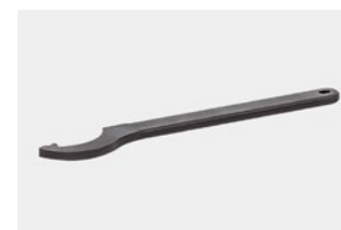
Llave de gancho Ref. 9150006024