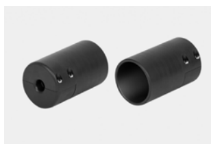
Embudo protector de pozo Ref. 2900130170