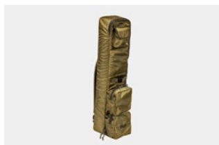
Mochila VX1 Ref. 8903170610