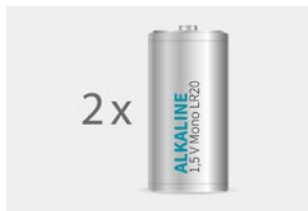
Batería alcalina 1.5 V MonoLR20, 2 unid. Ref. 5910001006S2