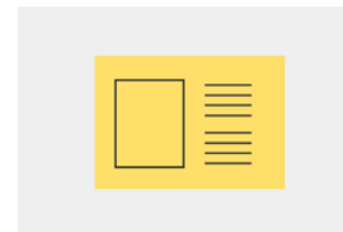
Croquis embalaje mochila VXC1 Ref. 2902460023