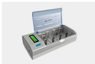
Cargador de batería externo Ref. 2909990847