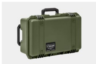
Maleta VXC1 Ref. 2802460001