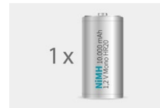
Batería recargable NiMH 1,2 V Mono HR20/10.000 mAh Ref. 5920001006