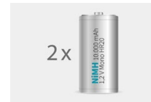
Batería recargable NiMH 1,2 V Mono HR20/10.000 mAh, 2 unid. Ref. 5920001006S2