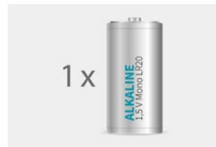
Batería alcalina 1.5 V Mono LR20 Ref. 5910001006