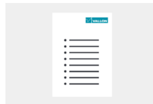
Manual operación VMX1 Ref. 2902460020