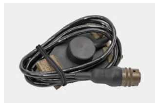
Auriculares VMC1/VMH3CS/VMXC1-1 Ref. 2909990571