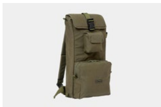
Mochila VXC1 Ref. 8902460102