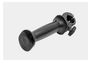
Empuñadura VXT1 Ref. 2902230029