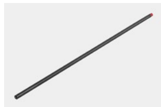
Sonda digital VSL Ref. 2909990675