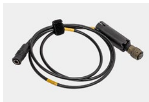
Cable conexión sonda VXT1 Ref. 2504140000