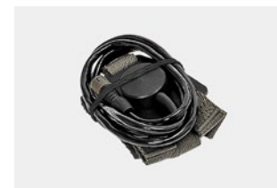
Auriculares VX1/VXT1 Ref. 2903170320