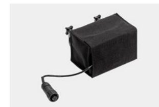
Set suministro eléctrico Ref. 2902200218