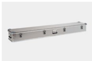
Maleta VXT1 Ref. 2804140000