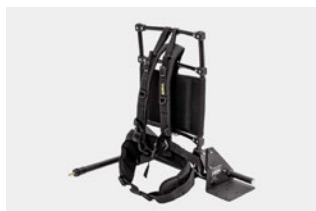
Soporte sonda VXT1 Ref. 2904140001