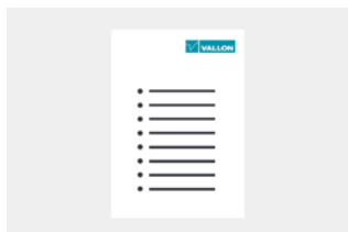
Instrucciones de uso VXT1 Ref. 2904140000