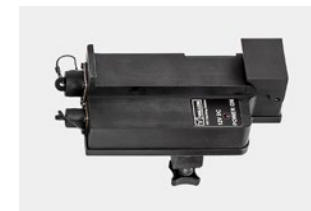
Adaptador unidad de control VXT1 Ref. 2904140010