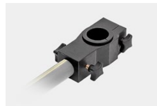
Clip de montaje sonda VXT1 Ref. 2902240006