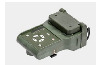
Unidad control VX1 Ref. 2903170040