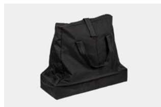
Mochila de transporte para soporte sonda VXT1 Ref. 2802240001