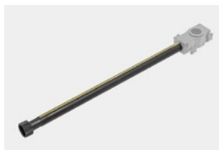
Barra de soporte frontal VXT1 Ref. 2102230006