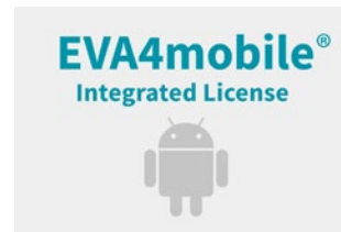
EVA4mobile® - Licencia integrada en combinación con el ordenador de campo VFC4.2 | Ref. 2405350010