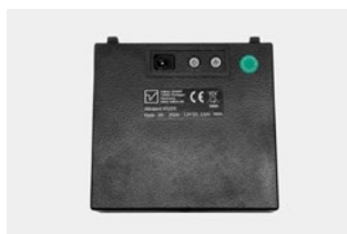
Batería VXB2/VXB3.1 Ref. 2902540104