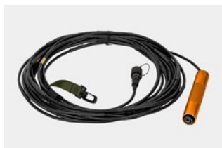
Cable sonda VXB3.1 SEPOS®, 15 m/12 m Ref. 2502590201