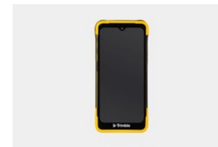
VFC4.2: Un pequeño ordenador de campo para EVA4mobile® Ref. 2005350002