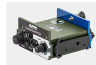
Unidad electrónica central VCU3 Temperatura ambiente: -20°C – +50°C Temperatura de almacenaje: -31°C – +60°C* Ref. 2002540310