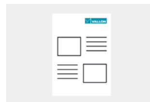
Manual de campo VFC4.2 Ref. 8905350002

*Atención: Temperatura de almacenamiento sin batería