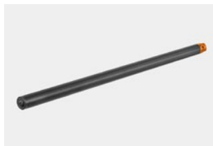
Sonda digital VSM4plus Ref. 2005320020