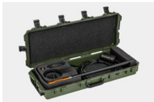
Kit sensor VXB3.1 Ref. 2902590201