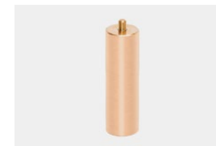
Peso adicional Ref. 2909990631