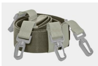
Cinturón Ref. 9150006007