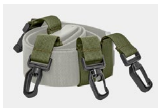
Mosquetón para cinturón Ref. 8902590005