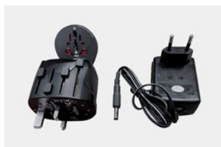
Set cargador Ref. 2902540110