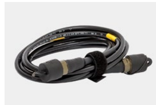
Cable conexión SEPOS®-Pozo (VCU) Ref. 2500130032