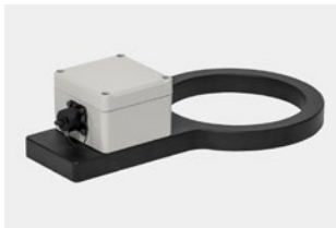
Detector SEPOS®- Pozo Ref. 2900130130