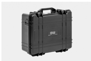
Maleta set electrónica VXB3.1 Ref. 2902590162