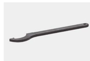
Llave de gancho Ref. 9150006024