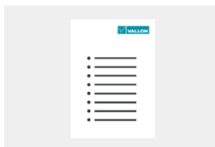
Manual operación VCU2 Ref. 8902540103