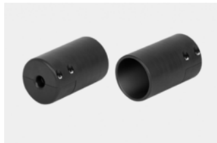
Embudo protector de pozo Ref. 2900130170