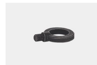
Anillo roscado Ref. 2909990105