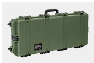
Maleta sonda VXB3.1 Ref. 2902590081