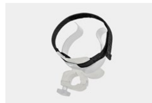
Sangle supplémentaire pour repose-bras MW1630B Réf. 8709990010