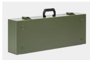
Valise MW1630B Réf. 2800530010