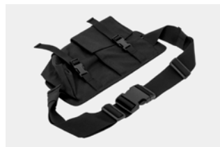
Sac pour l'unité électronique MW1630B Réf. 8900530030