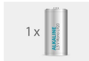
Pile alcaline 1,5 V Mono LR20 Réf. 5910001006