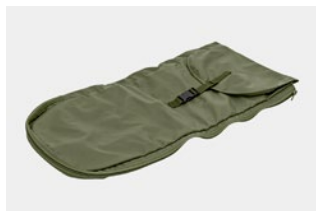
Sac à dos MW1630B Réf. 8900530008