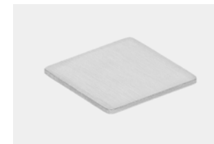
Plaque de test 35 x 35 x 2 mm, en aluminium (non-magnétique) Réf. 8909990384