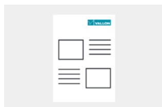
Manuel de terrain MW1630B Réf. 2900530011