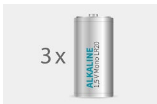
Piles alcalines 1,5 V Mono LR20, 3 unités Réf. 5910001006S3