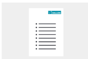
Mode d'emploi MW1630B Réf. 8900530011