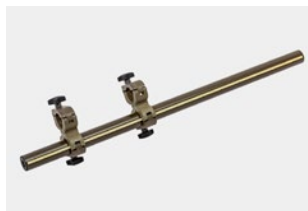
Extension de la barre de transport MW1630B Réf. 2900530005