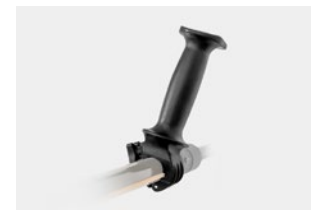
Poignée MW1630B Réf. 2900920016