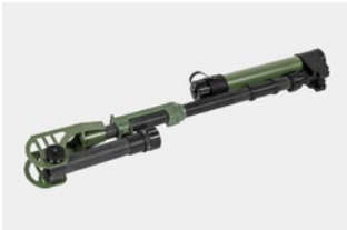
Barre de support VX1 Réf. 2903170030