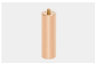
Poids additionnel Réf. 2909990631