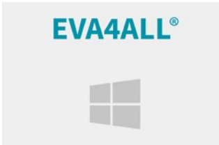
EVA4ALL® - Logiciel pour l'évaluation de données de surface et forage Réf. 2009090000