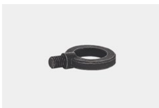
Piton Réf. 2909990105