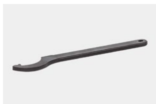
Clé à crochet Réf. 9150006024