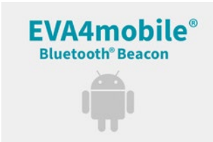
EVA4mobile - Bluetooth® Beacon pour l'activation de licence temporaire Réf. 2009080000