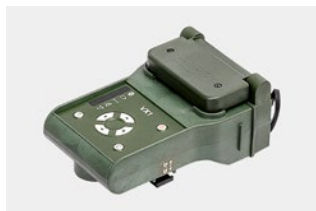
Unité de contrôle VX1 Réf. 2903170040