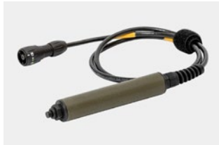
Interrupteur externe de démarrage/arrêt VX1 Réf. 2503170160