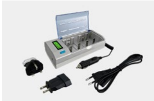
Chargeur universel externe 100-240V/50-60Hz, 12V Réf. 2909990847