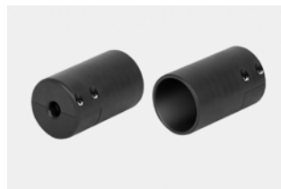
Protection de câble Réf. 2900130170