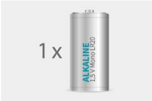
Pile alcaline 1,5 V Mono LR20 Réf. 5910001006