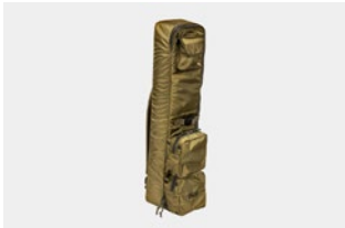
Sac à dos VX1 Réf. 8903170610