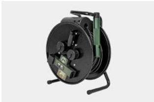
Touret de câble VX1 SEPOS®, 15/12 m Réf. 2903170470