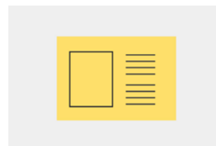
Descriptif de livraison VX1 Réf. 8903170890