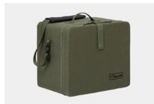
Sac de transport pour touret de câble VX1 Réf. 2903170401