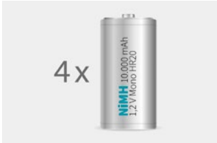
Accus NiMH 1,2 V Mono HR20/ 10.000 mAh, 4 unités Réf. 5920001006S4