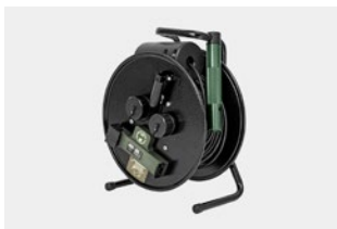
Touret de câble VX1, 25 Réf. 2903170260