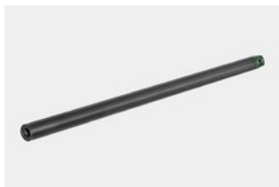
Sonde numérique VSM4 Réf. 2005320010