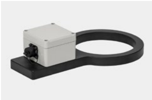
Détecteur SEPOS®-forage Réf. 2900130130