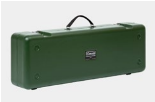
Valise VX1 Réf. 2903170410