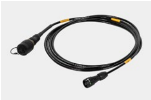
Câble de raccordement SEPOS® forage (VX1) Réf. 2503170040