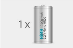
Accu NiMH 1,2 V Mono HR20/ 10.000 mAh Réf. 5920001006