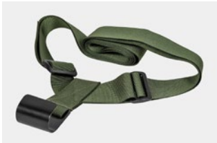
Sangle de transport VX1 Réf. 8903170820