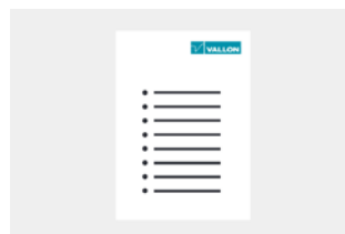
Mode d'emploi VX1 Réf. 2903170330