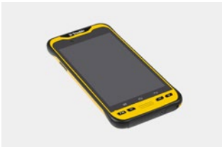
VFC4.1 - Ordinateur de terrain pour EVA4mobile® Réf. 2005350001