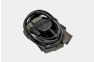
Casque écoute VX1/VXT1 Réf. 2903170320