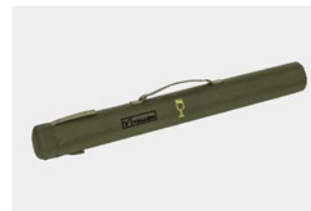
Conteneur de transport pour sonde numérique VSM4 Réf. 2903170450