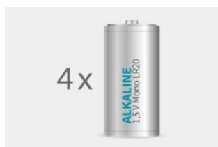
Piles alcalines 1,5 V Mono LR20, 4 unités Réf. 5910001006S4