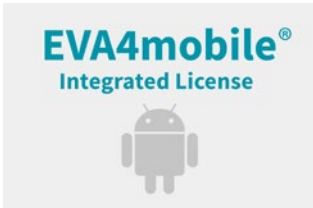
EVA4mobile® - Licence intégrée associée avec l'ordinateur de terrain VFC4 Réf. 2405350010