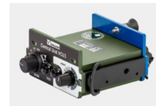
Unité centrale VCU3 Température ambiante: -20°C – +50°C Température de stockage: -31°C – +60°C* Réf. 2002540310