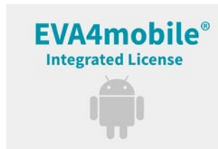
EVA4mobile® – Licence intégrée associée avec l'ordinateur de terrain VFC4 Réf. 2405350010