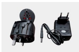
Kit chargeur Réf. 2902540110