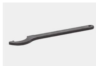
Clé à crochet Réf. 9150006024