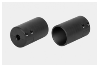
Protection de câble Réf. 2900130170