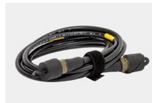
Câble de raccordement SEPOS®-forage (VCU) Réf. 2500130032