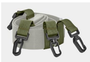
Mousqueton pour ceinture Réf. 8902590005