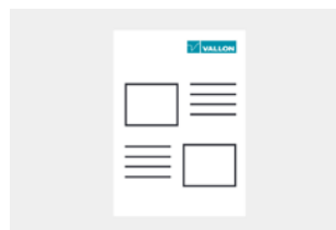
Mode d'emploi VFC4.1 Réf. 8905350000