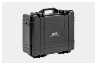
Valise kit électronique Réf. 2802590002