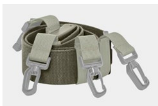
Ceinture avec crochets Réf. 9150006007