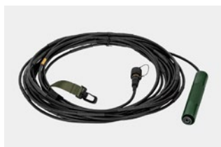
Câble capteurs VXB2.1 SEPOS®, 15 m/12 m Réf. 2502590001