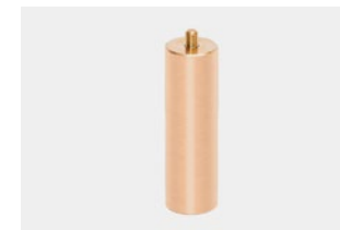
Poids additionnel Réf. 2909990631