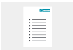
Mode d'emploi VCU2 Réf. 8902540103