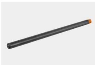
Sonde numérique VSM4plus Réf. 2005320020