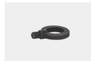
Piton Réf. 2909990105