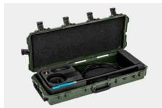
Kit capteurs VXB3.1 Réf. 2902590201