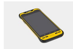
VFC4.1 – Ordinateur de terrain pour EVA4mobile® Réf. 2005350001