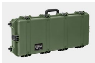
Valise kit capteurs Réf. 2802590001