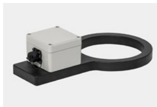
Détecteur SEPOS®-forage Réf. 2900130130