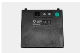
Accu VXB2.1/VXB3.1 Réf. 2902540104